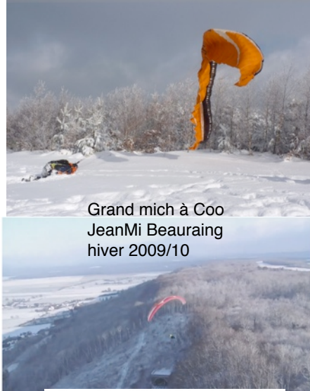
Grand mich à Coo JeanMi Beuraing hiver 2009/10